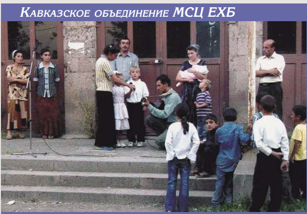
КАВКАЗСКОЕ ОБЪЕДИНЕНИЕ МСЦ ЕХБ