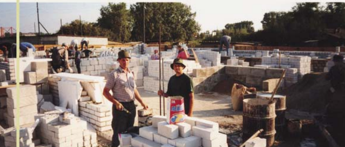
Архангельск. Строительство дома молитвы. Первый дом сожжен недоброжелателями.

Неплохое вроде бы свидетельство... Но когда нужно поехать на благовестие или на стройку молитвенного дома в какую-либо общину братства на неделю—две, начинаются трудности. «Не могу. Я пообещал работу сделать в срок. Мною будут недовольны... Мы — верующие и должны быть хозяевами своего слова...» И вместо святых дел, которые Господь призывает совершить (мы знаем, что только эти дела будут учтены на небе), наши хорошие специалисты, молодые и сильные братья, усердствуют исполнить то, что сулит хороший заработок и авторитет. Понятно, что глава семьи должен владеть какой-либо профессией, чтобы обеспечивать