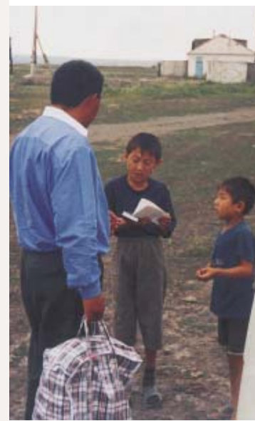
«Кого найдете, зовите на брачный пир». (Бастуши, Восточно-Казахстанская обл.)

сещает церковь. Во время беседы я попросил его рассказать, как он уверовал.