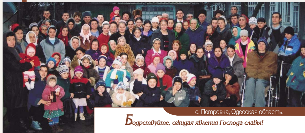
с. Петровка, Одесская область.

Богрствуйте, ожидая явления Господа славы!