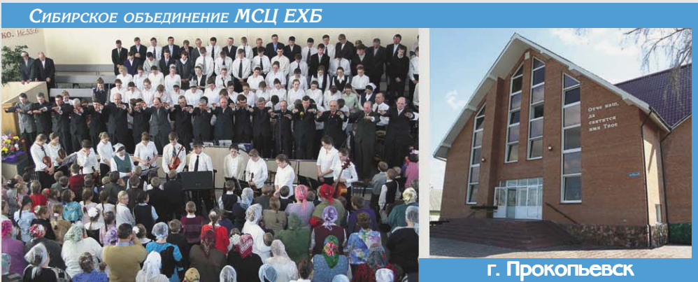
СИБИРСКОЕ ОБЪЕДИНЕНИЕ МСЦ ЕХБ