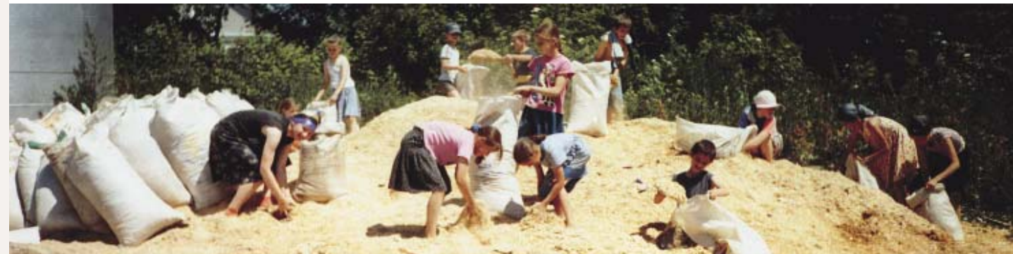
На строительстве молитвенного дома работа найдется каждому по его силе. (Хмельницкая обл.)