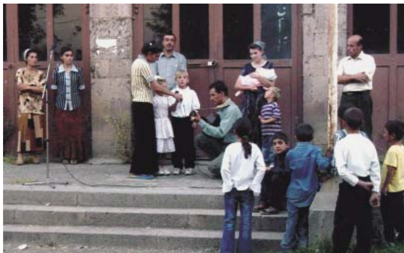
Армения, г. Ереван

Мы благодарны Господу, что по молитвам народа Своего Он хранит нас. Конечно, жене трудно оставаться одной с пятью детьми, но я благодарю Бога, что она никогда не препятствовала мне в служении. Молитесь, чтобы Господь и дальше хранил и дал нам дерзновение продолжать вверенное служение».