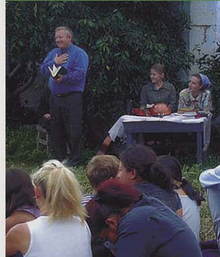
ОДЕССКОЕ ОБЪЕДИНЕНИЕ МСЦ ЕХБ хутор Шевченко

Духовно-назидательный журнал Международного союза церквей евангельских христиан-баптистов