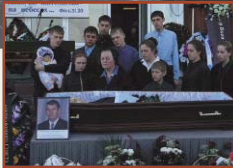
Семья и церковь в благоговейные минуты прощания.