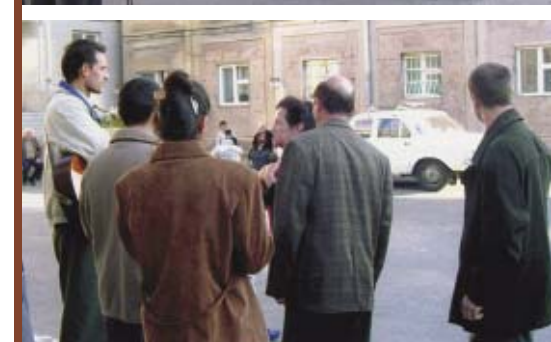
г. Ереван, Армения

Донести Весть спасения каждому — наш долг. Библиотечное (1) и евангелизационные (2, 3) служения в Ереване.