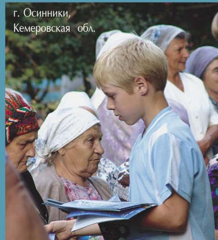
г. Осинники, Кемеровская обл.