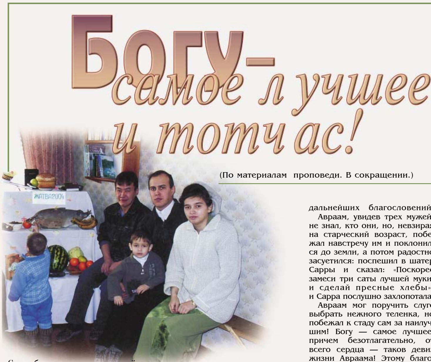
Семья благовестника и местный гость. п-ов Таймыр. Тикси.

Молодые христиане нередко затрудняются: Бог их позвал или они сами хотят сделать тот или иной шаг. «Как утвердиться и узнать волю Божию?» — мучительно напрягаются и юноши, и девицы. Одни начинают молиться, поститься, другие идут за советом к служителям, спрашивают родителей, и все равно полны тягостных сомне-