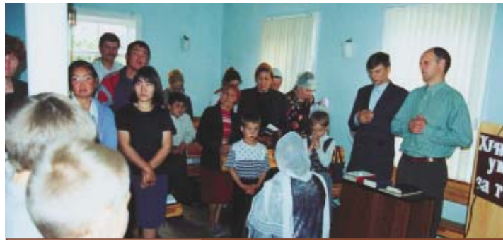
г. Кызыл, республика Тува.

Там, где бываем, не только обучаем верующих сурдопереводу, но и посещаем дома, где живут глухие, а также благовествуем в обществе глухих. Слушают с огромной жадой. Мало трудящихся на этой важной ниве. Мы молимся, чтобы число переводчиков умножилось».