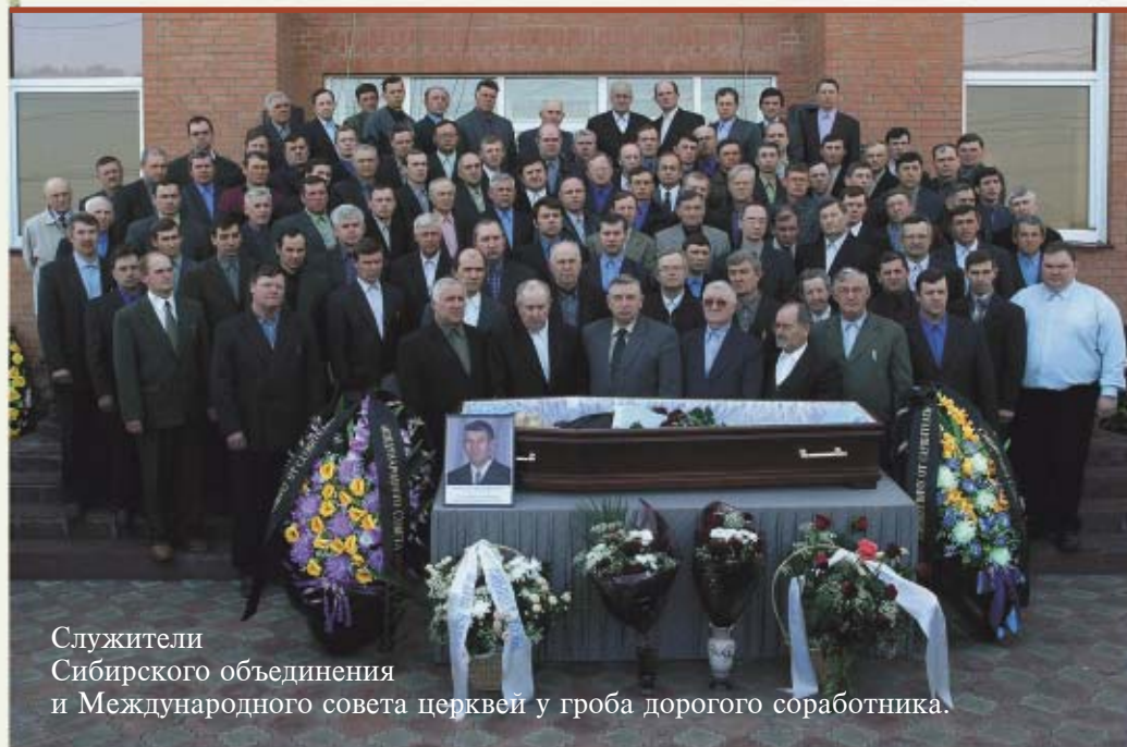
Служители Сибирского объединения и Международного совета церквей у гроба дорогого соратника.