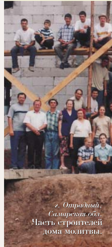
г. Отрадный, Самарская обл. Часть строителей дома молитвы.

Был я в этом городе, где живет на квартире этот молодой благовествующий брат. Там есть небольшая группа верующих. В этой местности мне нужно было посетить больного, который долгое время не по-