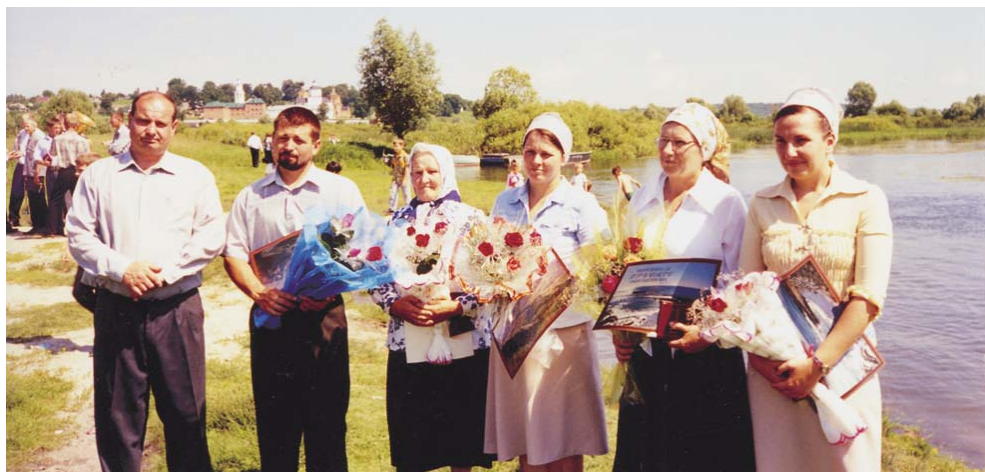
Получив спасение, они заключили завет с Богом, чтобы служить Ему во все дни жизни.

Некоторые из них нашли путь спасения благодаря безбоязненному свидетельству о Господе верующих, не постыдившихся возвещать о любви Божьей людям, не знающим своего Спасителя, Который пролил святую Кровь для их искупления».