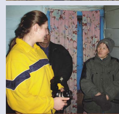
Посланники Христовы несут Весть спасения от дома к дому.