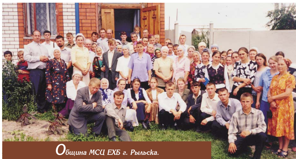
Община МСЦ ЕХБ г. Рыльска.