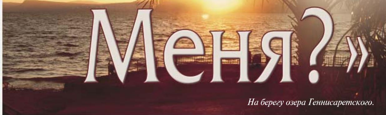
На берегу озера Геннисаретского.