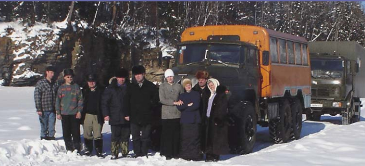
СИБИРСКОЕ ОБЪЕДИНЕНИЕ МСЦ ЕХБ