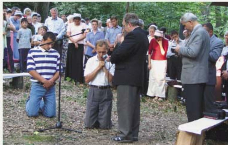
Они признали себя грешниками и получили спасение. (Молодежное общение. Западная Украина).

манывают; яд аспидов на губах их; уста их полны злословия и горечи. Ноги их быстры на пролитие крови; разрушение и пагуба на путях их; они не знают пути мира. Нет страха Божия перед глазами их» (Рим. 3, 10—18). Это характеристика всего человечества, значит и моя. Значит, в список неправедных вхожу и я. Таким видит меня не человек, а Сам всевышний Бог. Как не согласиться с Его словами? Как не признать, «что не живет во мне, то есть в плоти моей, доброе...» (Рим. 7, 18)?