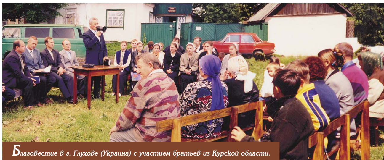
Благовестие в г. Глухове (Украина) с участием братьев из Курской области.