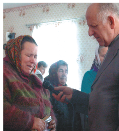
г. Уть, Белоруссия