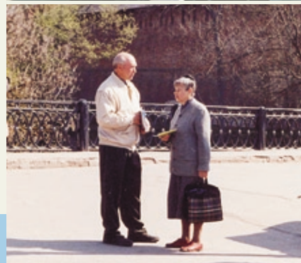
Благовестие в Великом Новгороде.