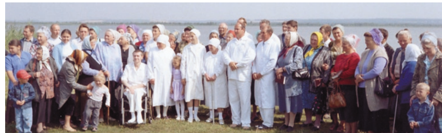
Господь прилагает спасаемых к Церкви, приближая тем самым Свой славный приход! (вверху — Хомутовская церковь, внизу — церковь г. Глухова (Украина).