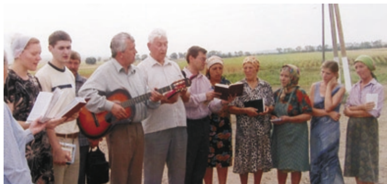
«Струн души рука Христа касается, и она восторженно поет...»

Другие — будучи обличаемы Духом Святым, отчаиваются: чувство вины и стыда лишает их веры в милосердие Божье.