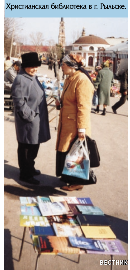
Христианская библиотека в г. Рыльске.