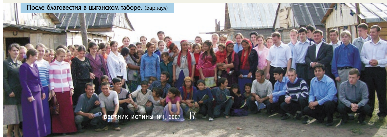
После благовестия в цыганском таборе. (Барнаул)

Между тем, исполняя повеление Иисуса Христа, нам следует идти со словом спасения ко всем погибающим из всякого колена, народа и языка. Каждый из живущих — богатый или бедный, ученый или невежда — должен узнать о подвиге Спасителя, Его безмерной любви к грешникам и о том, что сегодня есть еще возможность спасти свою душу от вечного осуждения! Поэтому необходимо благовествовать всем! □