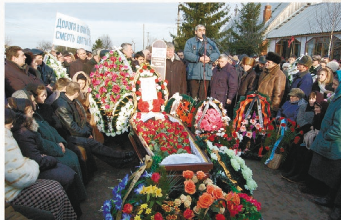
Прощальное богослужение у молитвенного дома Дмитровской общины МСЦ ЕХБ.