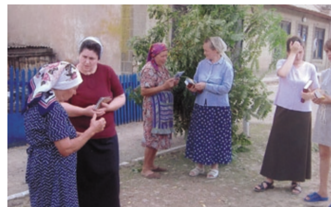
От дома к дому спешат с евангельской вестью...

Пробуждаются верующие и в зарегистрированных общинах ЕХБ, которые они посещают. Души каются, желая быть в постоянном общении с Богом. □