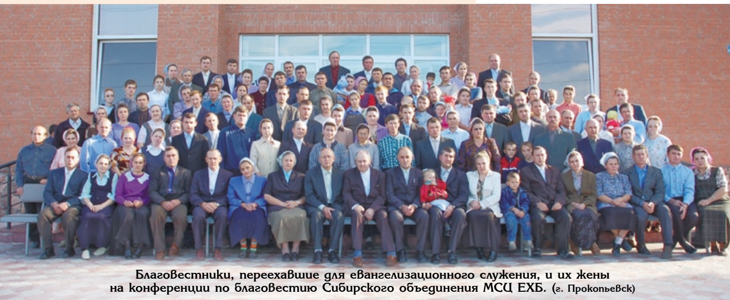
Благовестники, переехавшие для евангелизационного служения, и их жены на конференции по благовестию Сибирского объединения МСЦ ЕХБ. (г. Прокопьевск)