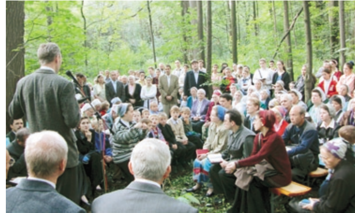
Богослужение Московской церкви МСЦ ЕХБ в Измайловском парке.

«Летом 2003 года мы не могли найти помещение для собраний и решили собираться на богослужения в Измайловском парке города. Осенью было очень холодно, дни становились короткими, богослужения приходилось сокращать.