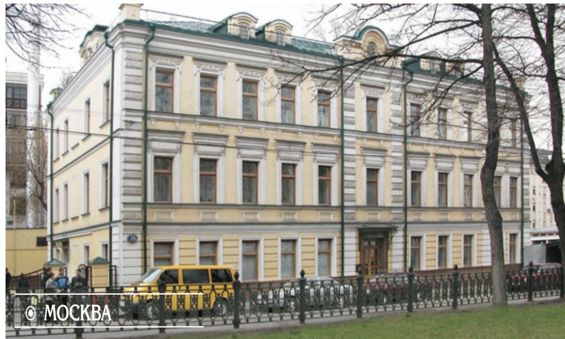
Дом, где проходят теперь богослужения Московской церкви МСЦ ЕХБ.

Нашему Богу имя Чудный! Чудеса совершались Им не только в прошлые времена. Он являет их нам и сегодня, ибо всемогущий Творец веки тот же.