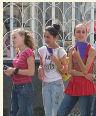
Свидетельство о Господе жителям Абхазии.