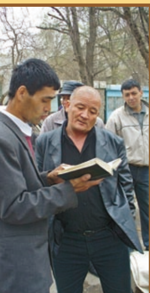
г. Карши, Узбекистан.