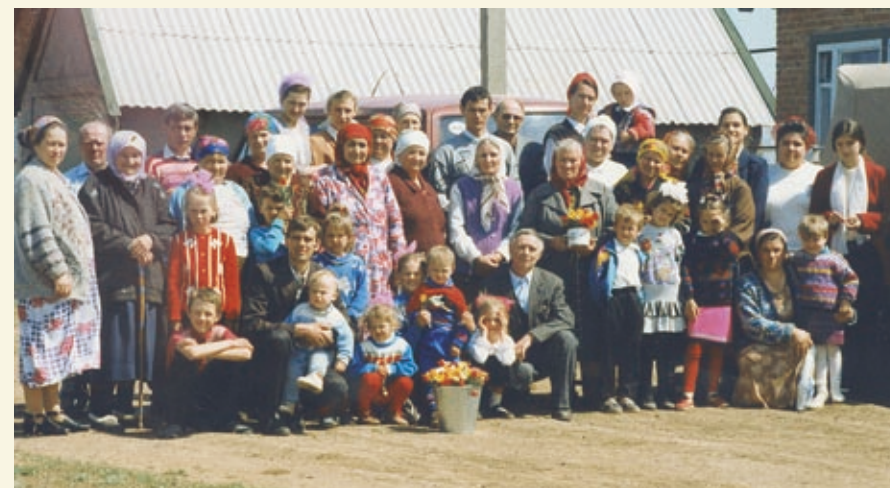
Община МСЦ ЕХБ на хуторе Нижнеантоновский.