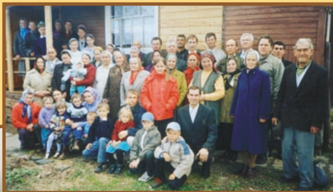
Община МСЦ ЕХБ г. Чебоксары.