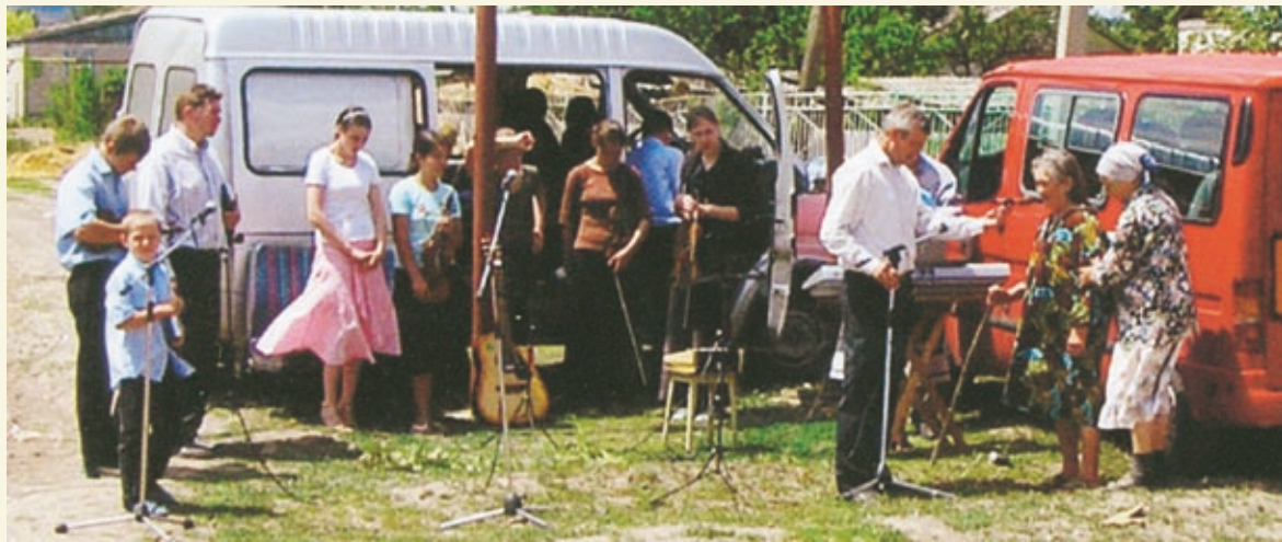
Покаяние двух женщин (справа у микрофона) во время благовестия на хуторе Паршиков.

ва зелень, потом колос, потом полное зерно в колосе; когда же созреет плод, немедленно посылает серп, потому что настала жатва» (Марк. 4, 26—29).