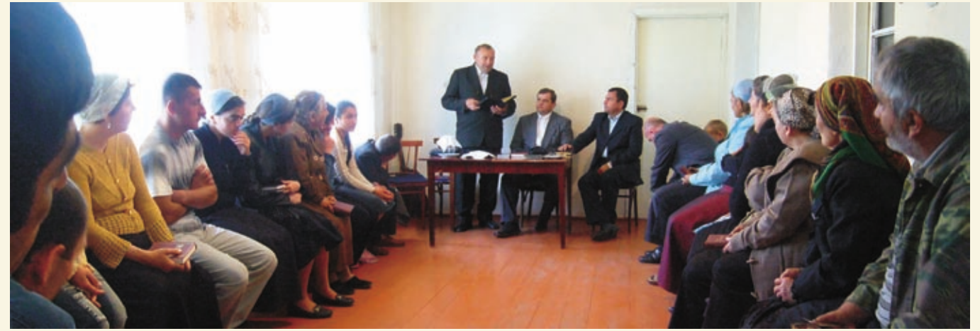
Богослужение в Мартакерте.

Первая в Армении церковь нашего братства появилась в с. Лукашино, где проживало много беженцев. Организовалась группа верующих и в Ереване, а также в других местах. Обретали спасение во Христе люди армянской национальности, и вскоре проповедь Евангелия зазвучала из их уст на родном для сограждан языке. Без удивления и радости нельзя было наблюдать, с каким доверием воспринимали