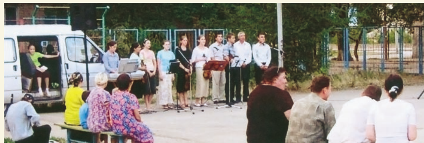
Призывное богослужение во дворе многоэтажных домов. (Волгодонск)

В июне 2007 г. прошло недельное благовестие с участием сводного камерного оркестра из церквей Ростовской области. Проповедовали о Христе во дворах многоэтажных домов, в местах, где собирается народ, в Цимлянском санатории, в тубдиспансере, в х. Паршиков. Общания проходили живо, ин-