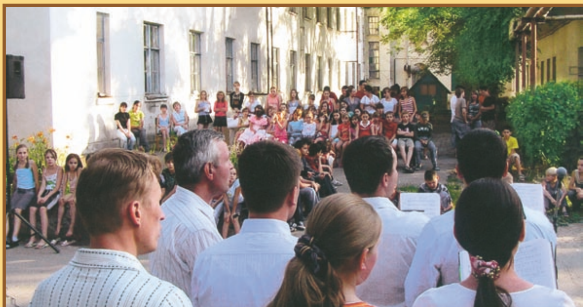
Благовестие в Цимлянском санатории (Ростовская область).