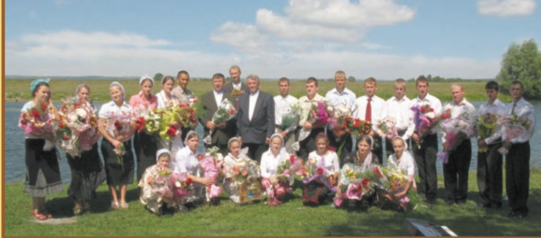
Вступившие в завет с Господом (Курская область, Анахино).