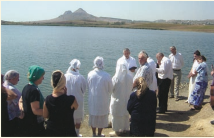
Обратившиеся из молокан стали членами Церкви Христа.

«Уверены, что все это произошло по изволению Божьему,— радуются подвигающиеся в благовестии,— чтобы и эти люди, нуждающиеся в спасении, услышали слово истины.