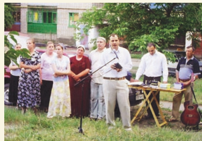
Евангелизационное служение для жителей г. Красный Сулин.

Братья и сестры общины города Красный Сулин молятся, чтобы Бог благоволил наполнить их церковь спасенными душами.