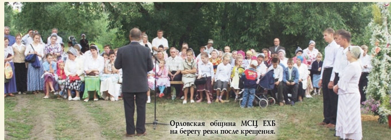
Орловская община МСЦ ЕХБ на берегу реки после крещения.

Группа верующих из церквей г. Орла и п. Нарышкино, взяв с собой своих детей-подростков, благовествовала в поселках Подзавалово и Парамоново Урицкого района Орловской области. Дети с удивительной быстротой и с радостью обходили дома и квартиры, приглашая людей на евангелизационное собрание.