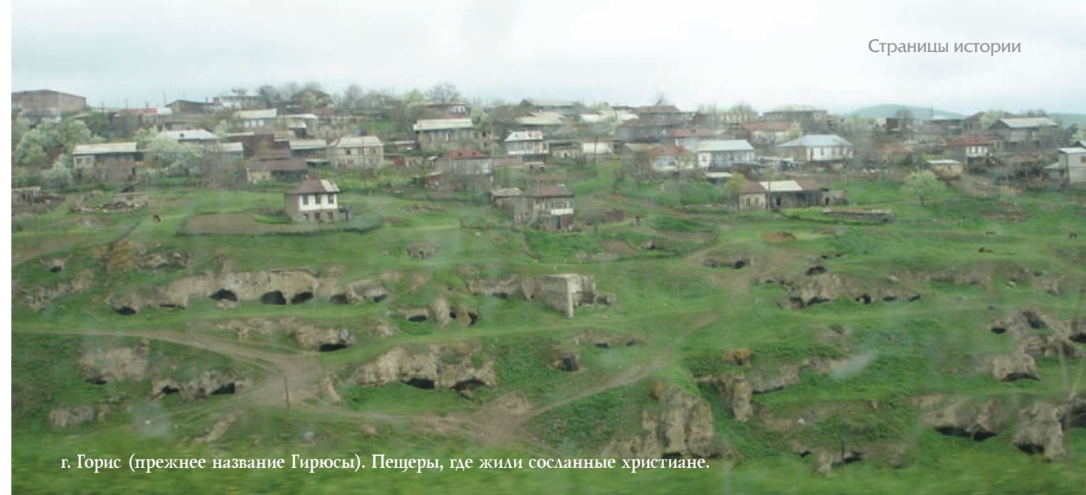
г. Горис (прежнее название Гирюсы). Пещеры, где жили сосланные христиане.

Полковник Пашков был в России четвертым человеком по величине состояния. Но всё почел за сор. Его дальнейшая христианская жизнь, уже пробужденного человека, убедительно об этом свидетельствует. Перед