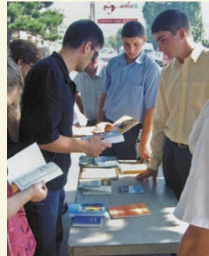
Служение христианской библиотеки и приобщение к Церкви Христовой новых членов Тбилисской общины МСЦ ЕХБ.

В служении благовестия мы всегда встречаем трудности: не всем нравится христианская библиотека. Несмотря на это, всё же есть жаждущие спа-