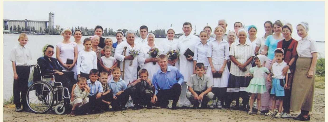
Народ Божий Волгодонской общины МСЦ ЕХБ в радостный день крещения.

тересно, с покаянием грешников. Особенно ревностное участие в благовестии принимала молодежь. От них старались не отстать подростки и дети. Радует то, что все члены церкви, в том числе и пожилые, охотно откликаются на любой труд, совершая его усердно, доброхотно, молитвенно поддерживая евангелизационное служение.