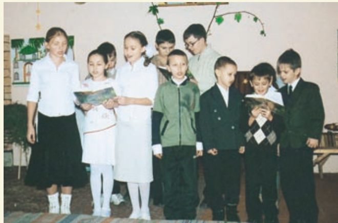
Детский хор церкви г. Волгодонска прославляет Господа.

сближаются, их роднит святая цель. Благовестие настолько удивительно сочетается с жизнью каждого члена церкви, что невозможно проследить всех дел по спасению грешников, и лишь результаты свидетельствуют о Божьих благословениях. Об этом точнее сказал Иисус Христос: «Царствие Божие подобно тому, как если человек бросит семя в землю, и спит, и встает ночью и днем, и как семя всходит и растет, не знает он; ибо земля сама собою производит спер-