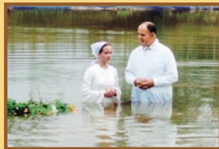
Крещение на острове Сахалин.