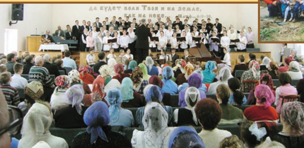
40 лет служения хора Павлодарской церкви МСЦ ЕХБ.