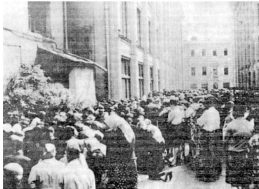
Делегация верующих ЕХБ склонилась для молитвы в узком переулочке на Старой площади, куда ее направили от главного входа ЦК. Здесь делегация провела день и ночь в ожидании ответа.