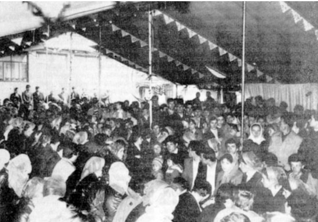
МОЛОДЕЖНОЕ ОБЩЕНИЕ МОЛДАВИИ (3 мая 1987 г.)

За это право благовествовать Евангелие Христово и за стремление исполнить заповеди Его и служить Ему с малолетними и юношами нашими много теснили наше братство. Но вот мы не только живы, но и расширяются шатры народа Божьего, он умножается числом и молодое наследие Христа славит Его в собрании святых. Это ли не дело милости Божьей?! Прославим же Его за этот щедрый дар!