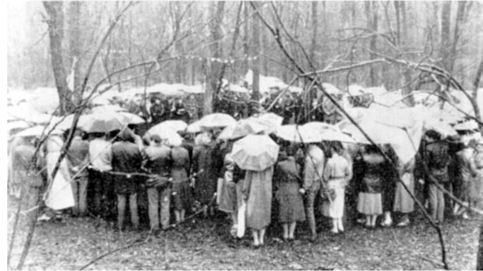
ОБЩЕНИЕ МОЛОДЕЖИ (г. ОДЕССА)

Около 600 человек христианской молодежи съехалось в с. Страшены. Благословенно прошло служение, главной темой которого были слова Ап. Павла: "Для меня жизнь — Христос, а смерть — приобретение" (Фил. 1, 21). 40 душ обратилось к Богу с покаянием.