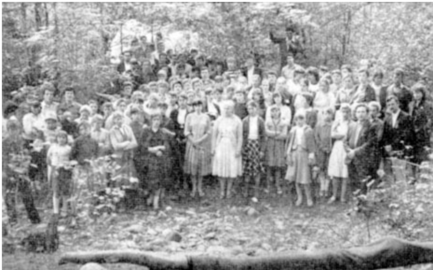
ХРИСТИАНСКАЯ МОЛОДЕЖЬ (Краснодарский край) СЛАВИТ ГОСПОДА В ОБЩЕНИИ СВЯТЫХ