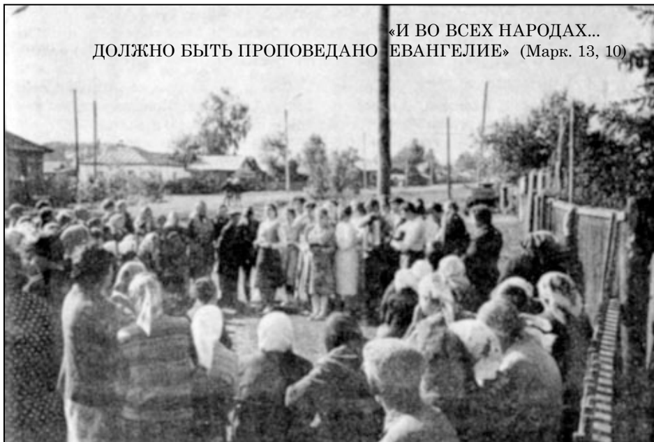
«И ВО ВСЕХ НАРОДАХ... ДОЛЖНО БЫТЬ ПРОПОВЕДАНО ЕВАНГЕЛИЕ» (Марк. 13, 10)

Но возможность свидетельствовать о Боге не везде одинакова. На ст. Ояш молодежи не дали провести богослужение, хотя заранее приглашенные жители поселка к назначенному времени стали собираться на место. Представители исполкома, сотрудники милиции возвращали народ. Когда молодежь стала петь — включили сирену. Побеседовали с неверующими только возле вокзала.