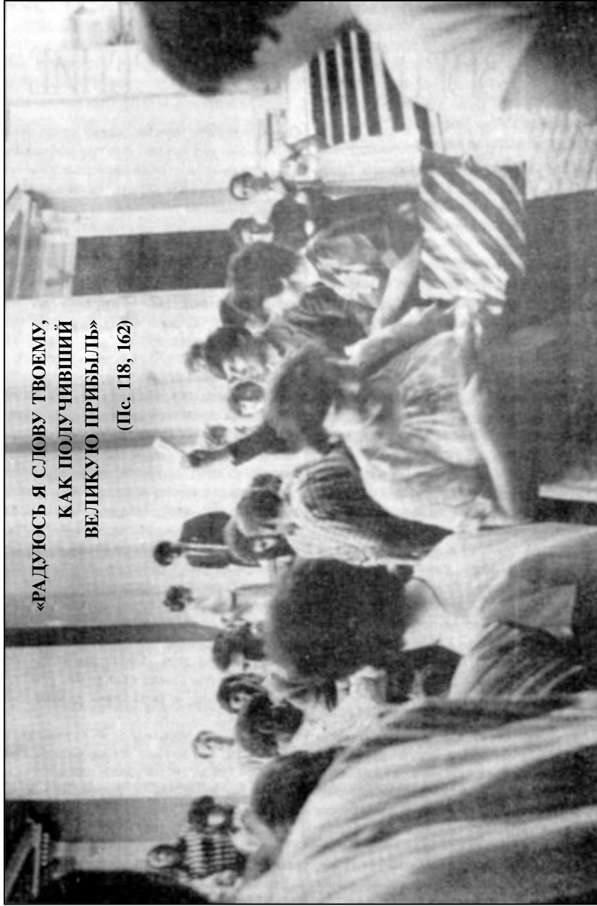
Молодежь Ленинградской церкви СЦ ЕХБ раздает Евангелия в Александро-Невской лавре

«РАДУЮСЬ Я СЛОВУ ТВОЕМУ, КАК ПОЛУЧИВШИЙ ВЕЛИКУЮ ПРИБЫЛЬ» (Ис. 118, 162)