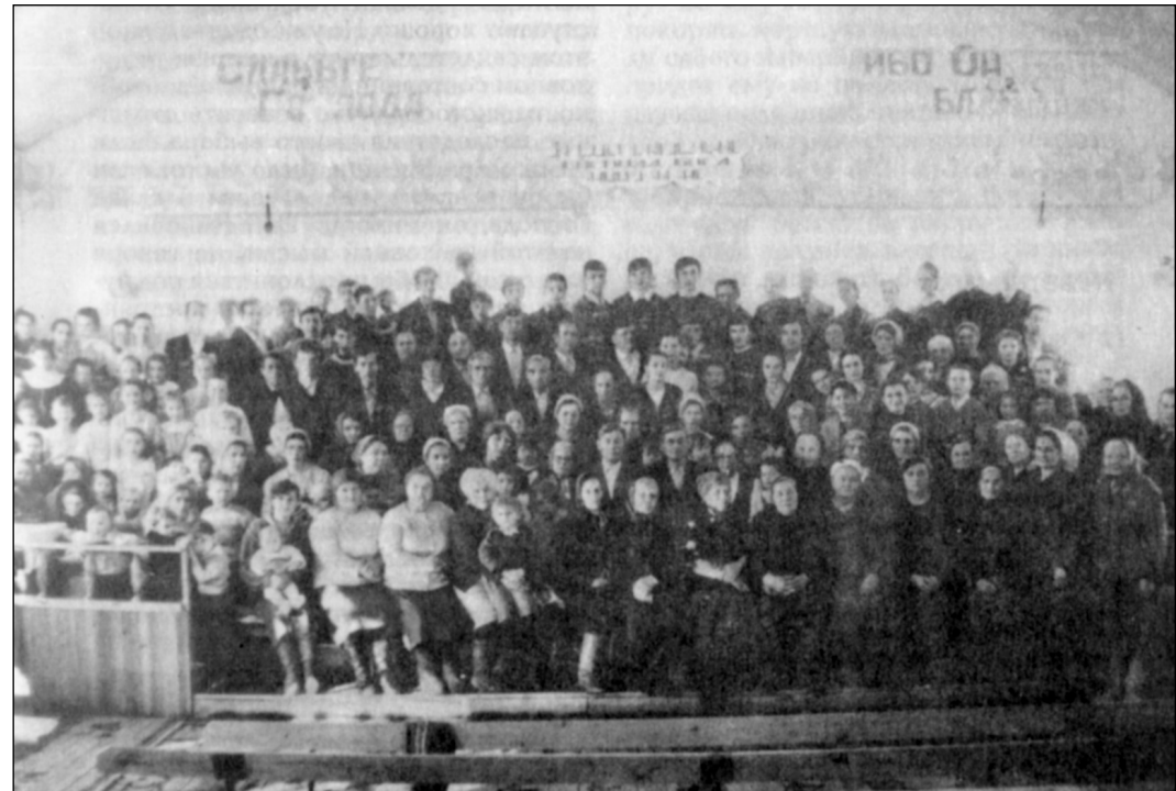
Община СЦ ЕХБ г. Анжеро-Судженска