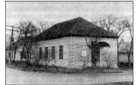
Отобранный молитвенный дом

Верующие много писали жалоб в правительственные учреждения, но ответа не получили. Тяжело было смотреть, как в присутствии сотрудников милиции рабо-