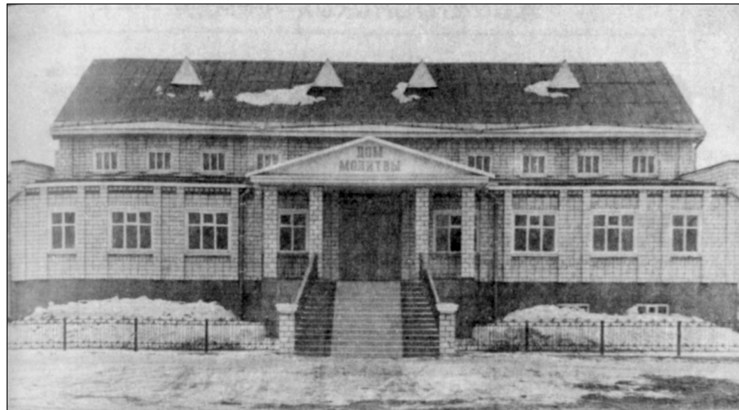
Новый молитвенный дом общины СЦ ЕХБ г. Славгорода

Церковь Божья — Небесная Страница, ждет тебя обетованный град!