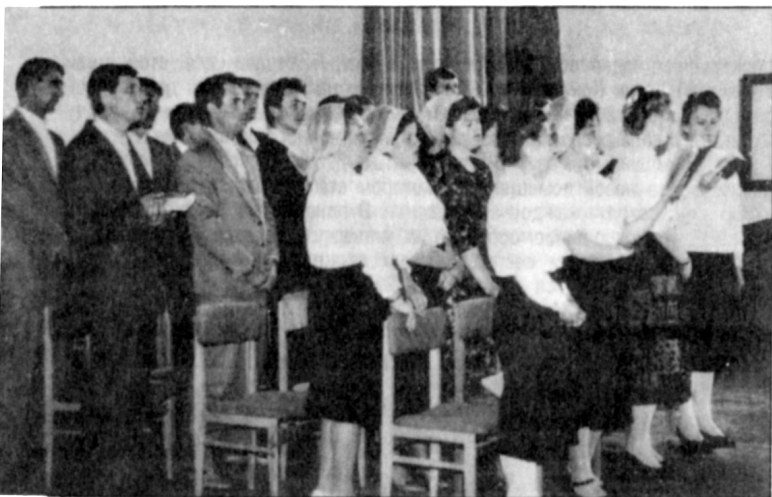
Пасхальное богослужение братьев и сестер Сакской общины СЦ ЕХБ в санатории для инвалидов.