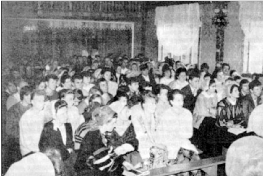
Общение христианской молодежи Западно-Украинского объединения СЦ ЕХБ. (Киверцы, ноябрь 1995 г.)

17–18 ноября 1995 года в молитвенном доме поместной церкви прошло общение христианской молодежи Западно-Украинского объединения СЦ ЕХБ. Это уже второе двухдневное общение. Основной темой проповедей был стих из книги пророка Исаии: «Утомляются и юноши и ослабевают, и молодые люди падают, а надеющиеся на Господа обновятся в силе; поднимут крылья, как орлы, потекут, и не устанут, пойдут, и не утомятся» (40, 30–31). Дух Святой через слово назидания открывал: в чем сила юношей, какие могут быть причины утраты духовной силы; что такое полная надежда на Господа и как практически уповать на Бога во всех обстоятельствах жизни. Господь явил благодать Свою как в обильном духовном назидании, так и в покаянии юных душ.