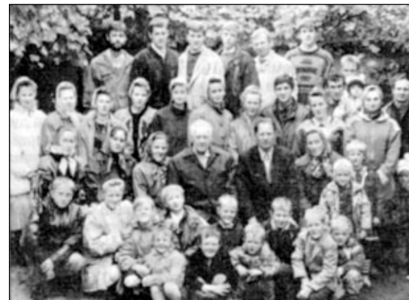
Община СЦ ЕХБ г. Сарны.

Члены Сарненской общины участвовали в палаточном благовестии, а в сентябре 1995 года, пользуясь их радушием, здесь прошло областное общение христианской молодежи.