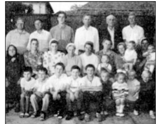
Группа верующих нашего братства в селе Тростник.

Есть нужда в молитвенном доме. Дети Божьи молятся Господу и уповают на Него, что Он в Свое время восполнит и эту нужду и поможет им и дальше идти путем очищения и освящения и приобретать души для Христа.