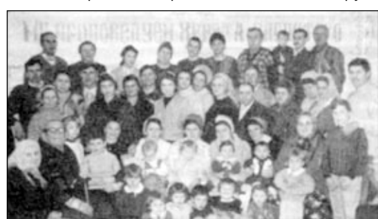
Буденновская община СЦ ЕХБ.

В конце 60-х годов брат, ныне покойный, отбыл 5 лет в лагерях общего режима. В 80-е годы пятилетний срок заключения отбывала сестра. В эти же годы 2 месяца пробыл в тюрьме под следствием другой брат, затем он был судим товарищеским судом на предприятии города. Слава Богу, все сохранили верность Господу!