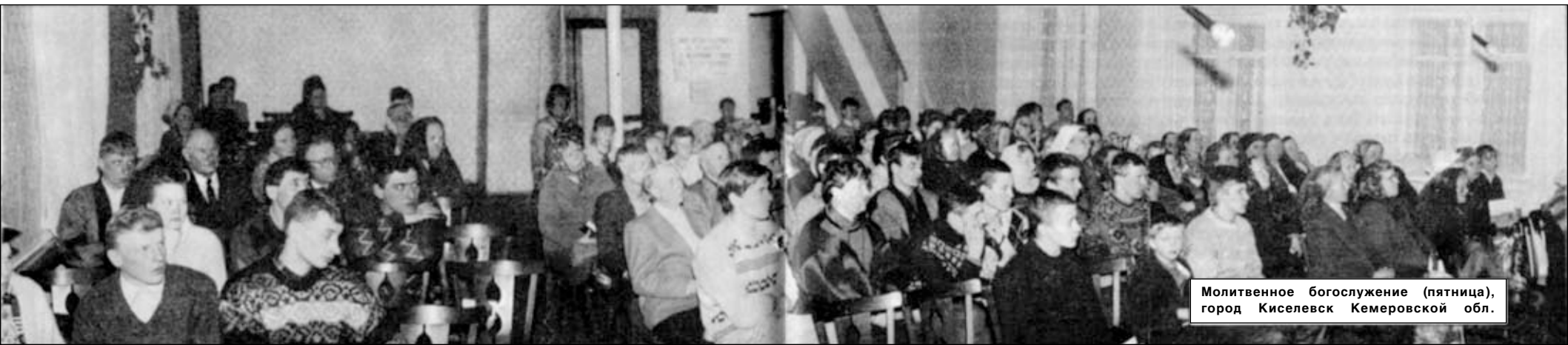
Молитвенное богослужение (пятница), город Киселевск Кемеровской обл.