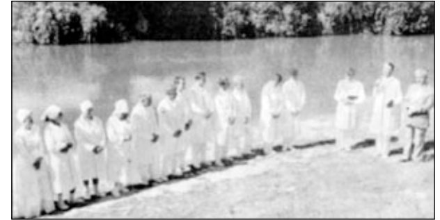
Они стали членами Церкви Христовой! (Луцк)

20 проповедников (из них почти половина молодых) каждое богослужение готовы делиться духовными наставлениями с народом Божьим – никто не отказывается от участия в проповеди. Из 13 крещаемых в 1995 году – восемь пришли из мира. В настоящее время в церкви г. Луцка 189 членов, 120 детей, молодежи – 45 человек.