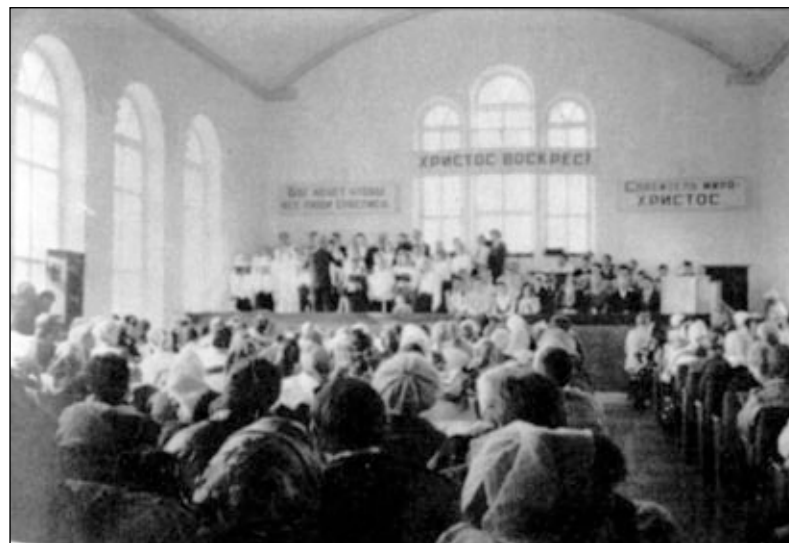
Первое богослужение в новом молитвенном доме Узловско- Новомосковской общины СЦ ЕХБ.