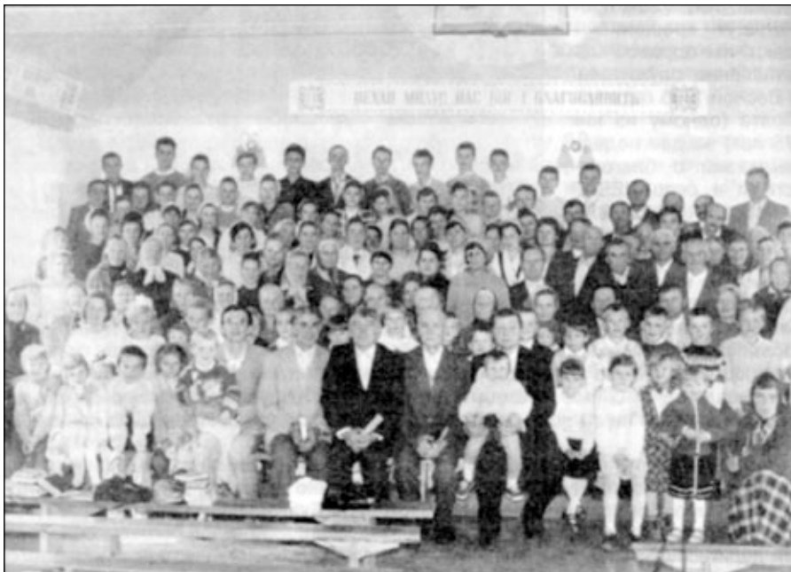
Община СЦ ЕХБ г. Ровно.

в общине 117 членов. Проводятся членские собрания, воспитательные беседы с молодыми христианами, с хористами, с оркестрантами, чтобы не потерять ни одной души, пришедшей в церковь.