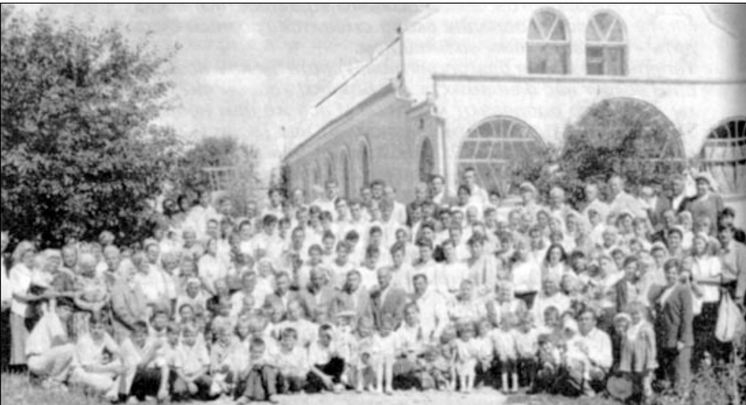
Луцкая община СЦ ЕХБ у нового молитвенного дома.

РОВНО Дети Божьи Ровенской общины уже три года каждое воскресенье выезжают с благовестием в села, где нет верующих. Проповедуют Слово Господне прямо на улицах. Слушают многие, но каются единицы.