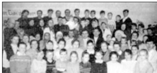
Община СЦ ЕХБ г. Димитровграда.

Рязанская церковь сегодня насчитывает 270 членов. За полтора года ревнующие о благовестии через раздачу книг Священного Писания обошли более 150 населенных пунктов.