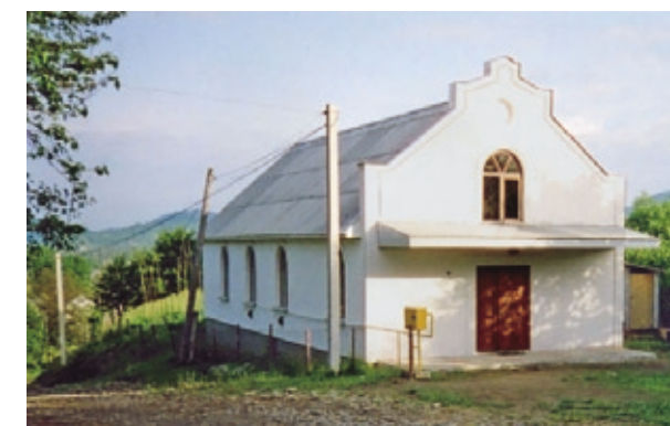
Новый молитвенный дом (с. Терново, Закарпатье)