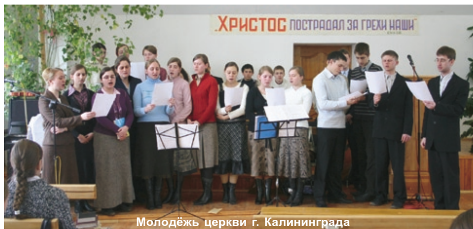
Молодёжь церкви г. Калининграда