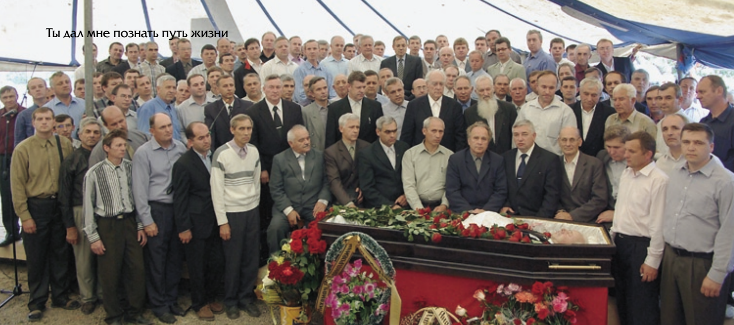
Служители братства МСЦ ЕХБ прощаются с дорогим соратником.

была внушительная — двухлетний заработок высококвалифицированного рабочего. Я только сейчас об этом рассказываю.