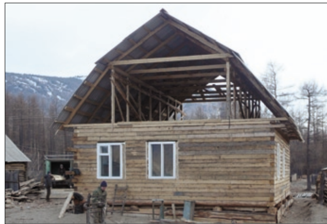
Молитвенный дом в п. Алыгджер.

тия (четыре брата и четыре сестры) проводили богослужения в арендованном доме в Нерхе (второй по величине посёлок в Тофаларии). В душах жителей есть стремление приблизиться к Богу. Внутреннего сопротивления нет, плачут, стыдятся своих грехов. Внимательны, видно, что Слово Божье влечёт их сердце. Молились, некоторые каялись. Время покажет, насколько искренни их молитвы. Женщина, постоянно посещавшая собрания, сокрушалась. Господь работает над её душой. Есть надежда, что её покаяние будет решительным поворотом и обновлением жизни.