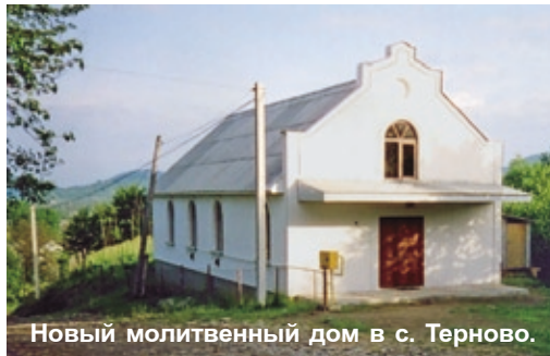
Новый молитвенный дом в с. Терново.

Благослови, Господи, начатое Тобой дело, а братьям и сестрам помоги сохранить верность Богу до конца, чтобы получить венец жизни и жребий с освящёнными на небесах. □