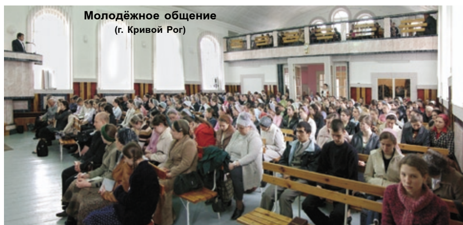
Молодёжное общение (г. Кривой Рог)