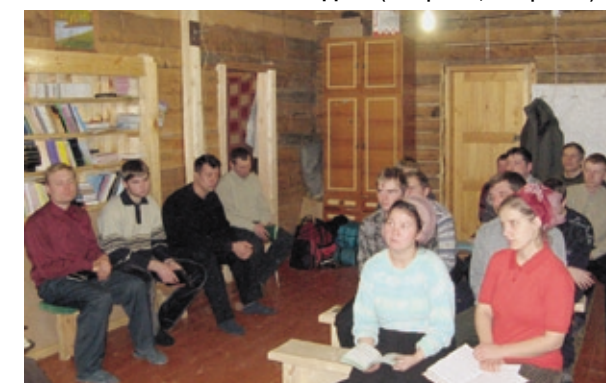
Богослужение в новом молитвенном доме (п. Алыгджер)