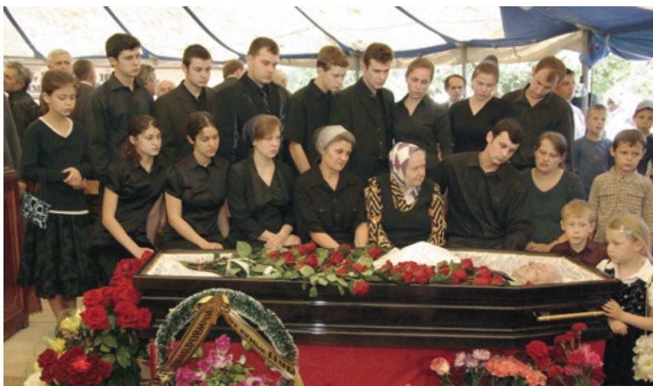
Тяжёлая скорбь родных умерялась светлой надеждой на скорую встречу в небесах.

Тяжёлая скорбь жены, разделившей трудный и благословенный путь со своим мужем, печаль и слёзы детей, ещё не возросших, в большинстве находящихся в родительском доме, не была безутешной. Она умерялась светлой надеждой на скорую встречу в небесах. □