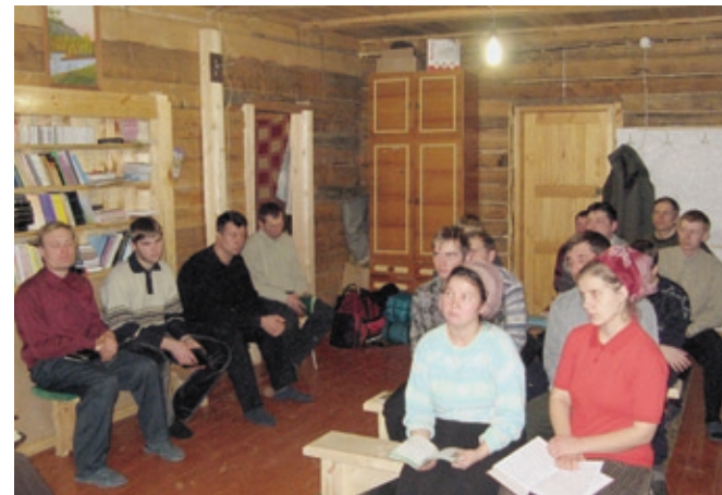
Богослужение в новом молитвенном доме (п. Алыгджер)

Пока шли строительные работы, группа благовес-