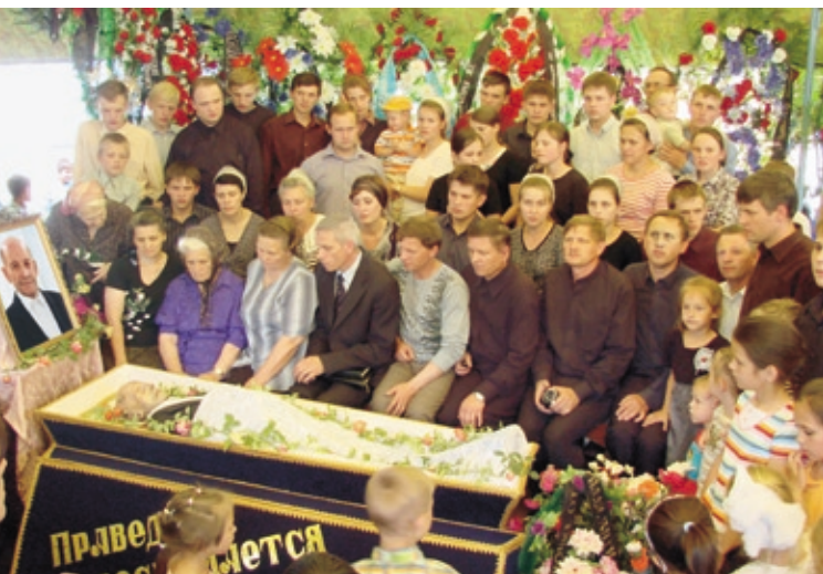
Жена, дети, внуки и правнуки в день скорби.

3 июля 1978 года его арестовали в городе Ростове-на-Дону и этапировали в Джамбул, где осудили на 5 лет строгого режима. Когда же срок подошёл к концу, поставили условие: не мешать на свободе регистрации Джамбульской общины. Он не согласился и вместо освобождения был отправлен в следственный изолятор № 13, где судом ему добавили еще 3 года строгого режима. Этот срок пришлось отбывать в особо тяжёлых условиях на полуострове Мангышлак, в городе Новый Узень. В общей сложности мужественный воин Христа провёл в неволе 11 лет и четыре года нёс служение в нелегальных условиях.