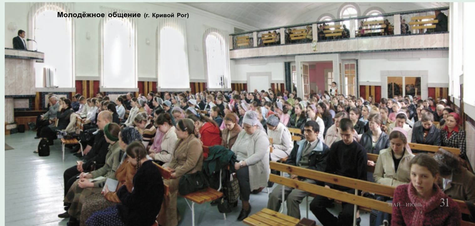
Молодёжное общение (г. Кривой Рог)

Каждого человека Господь направляет на добрый путь, но юность своевольна, упряма.