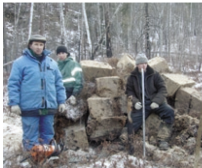
Напилен мох для утепления дома.

Благовестники наших дней движимы той же пастырской заботой о душах и считают своим долгом посещать те места, где уже прозвучало слово благодати. Дороги туда повышенной сложности, и каждый год трудности непредсказуемые, не похожие на прошлые. Но и Христос благовествовал до утомления (Иоан. 4, 6).