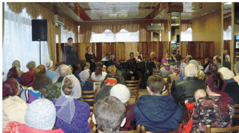
г. Семенов г. Чебоксары