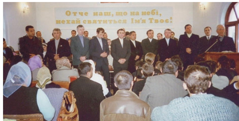
Первое торжественное богослужение в с. Терново в новом молитвенном доме.

«В области у нас есть очень большой древний город Артёмовск (в прошлом Бахмут). Церкви нашего братства там нет. Почти два года в нём работают две выездные христианские библиотеки. Мы хотим приобрести там молитвенный дом. Поддержите нас в молитвах, — просит служитель, ответственный за благовестие в области. — Чтобы не забыть об этой нужде, вам стоит только взглянуть на пачку соли. И в России, и на Украине употребляют артемовскую соль. Когда будете что-то солить, вспомните и помолитесь о грешниках г. Артёмовска, которым необходим дом, где они могли бы услышать слово спасения». □