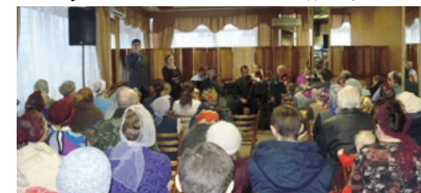
Евангелизационное служение (г. Семенов, Нижегородская обл.)