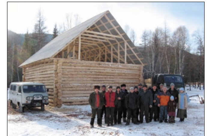
Срубленный за 9 дней молитвенный дом в п. Нерха.

Затем группа благовестия отправилась в Алыгджер. Первое собрание провели для верующих с вечерей. Радовались посещению все, но особенно брат, принявший крещение летом 2007 года. После собрания он пригласил гостей к себе. Жилище его преобразилось (5 лет он живёт один): чисто, всё постирано, стены выбелены. Слова излишни: душа его преобразилась и всё вокруг свидетельствовало о новой жизни с Богом. □