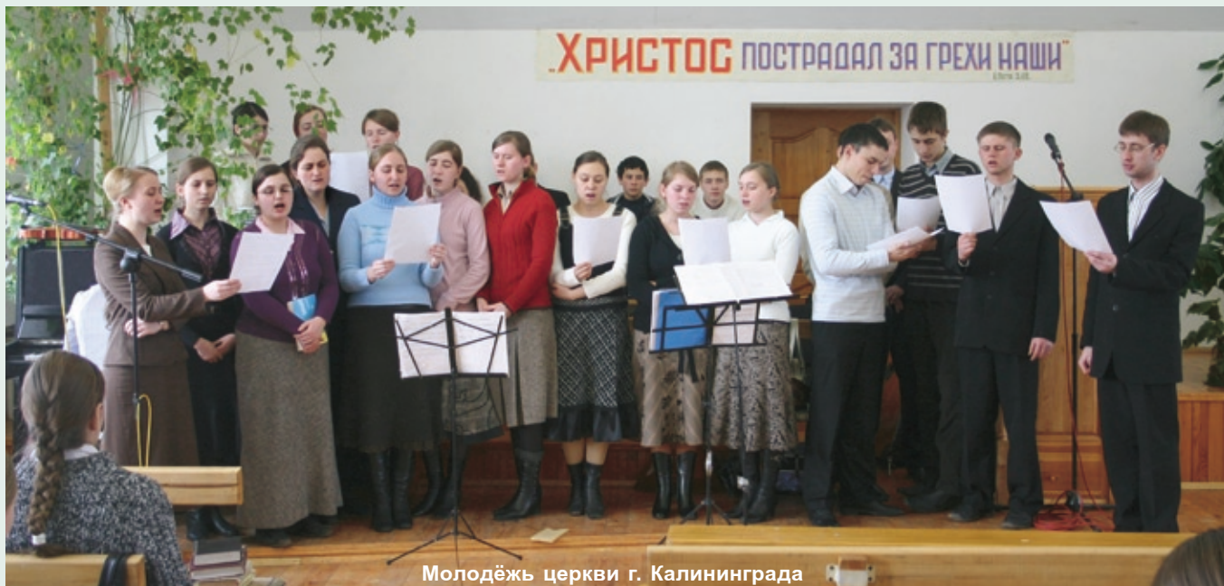
Молодёжь церкви г. Калининграда

«Блаженны чистые сердцем, ибо они Бога узрят» (Матф. 5, 8). □