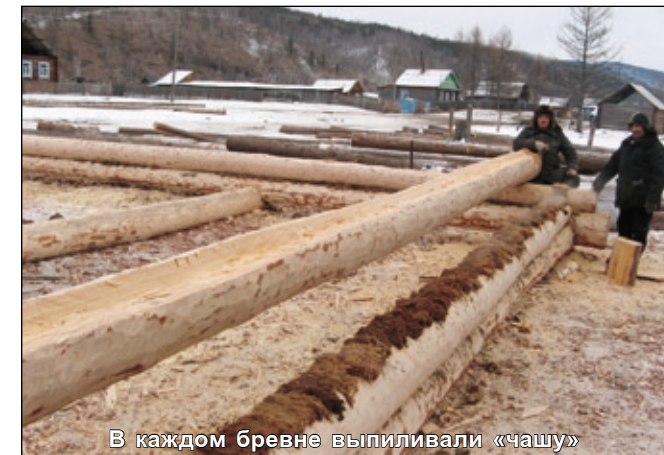
В каждом бревне выпиливали «чашу» и укладывали ярус за ярусом, простилая мох.

В Нерхе решили рубить молитвенный дом из круглых брёвен, как в старину. Брёвна для фунда-