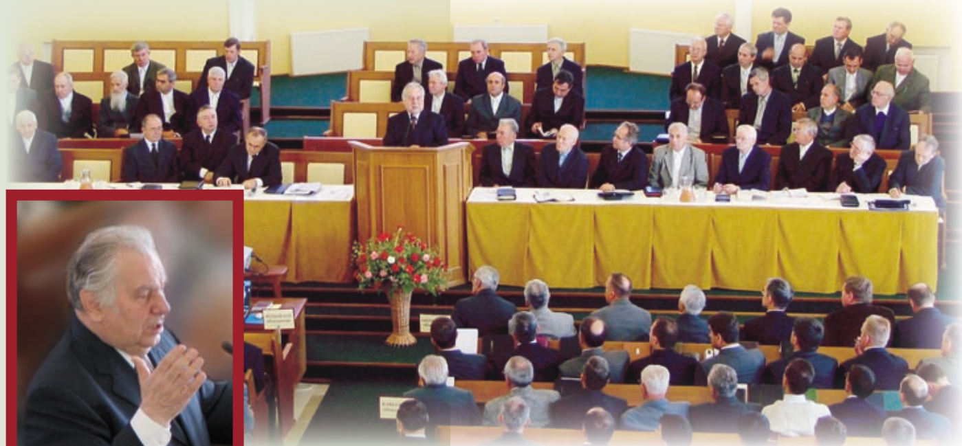
Слово отчёта Г. К. КРЮЧКОВА на общецерковном съезде 2005 года