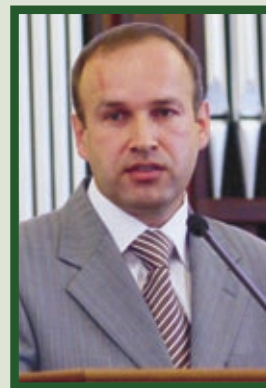
Ты последовал мне в учении... 2 Тим. 3, 10