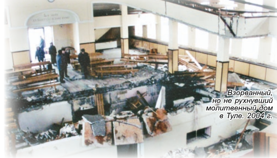
Взорванный, но не рухнувший молитвенный дом в Туле. 2004 г.

Нам бы такое сердце, как у Моисея. О, если бы мы поступали так и в личном хождении, и в церковной жизни: «Если Ты не пойдёшь, не выводи...» Без Бога – всё тщета. Только на Его Божественной силе,