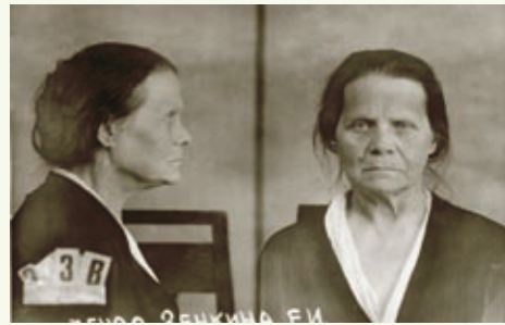
брания проходят у меня на квартире по воскресным дням вечером. Я читаю книги, журнал "Христианин", все вместе поем...»