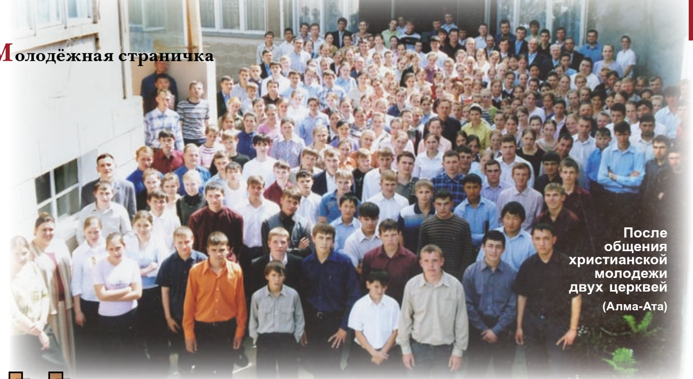
После общения христианской молодежи двух церквей (Алма-Ата)

Кстати. При знакомстве с расстрельными протоколами допросов, обнаруживается замечательное явление: мученики Красноворотской церкви, отказываясь признавать и применять на практике неверные решения съездов, ссылались не на решение церкви по этому вопросу, а на личные убеждения. Это единственно правильная позиция, на которой стояли и стоят верующие нашего братства. Наши братья-солдаты, мученики, жизнь свою отдали, сберегая чистоту сердца, но при этом не ссылались ни на уставы братства, ни на решения съездов или членских собраний, потому что гражданские вопросы церковь не затрагивает. Утверждённые лично, укрепленные Господом, они шли на подвиг по велению совести. ■