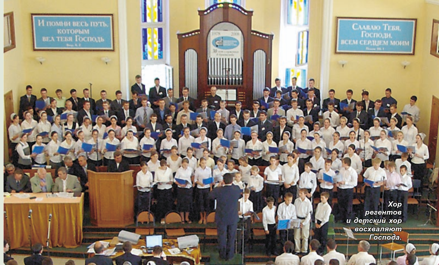
Хор регентов и детский хор восхваляют Господа.